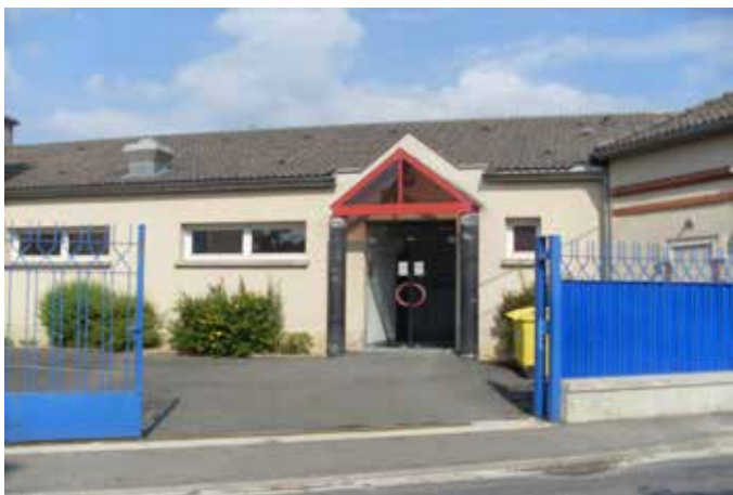
Entrée de service rue Carnot