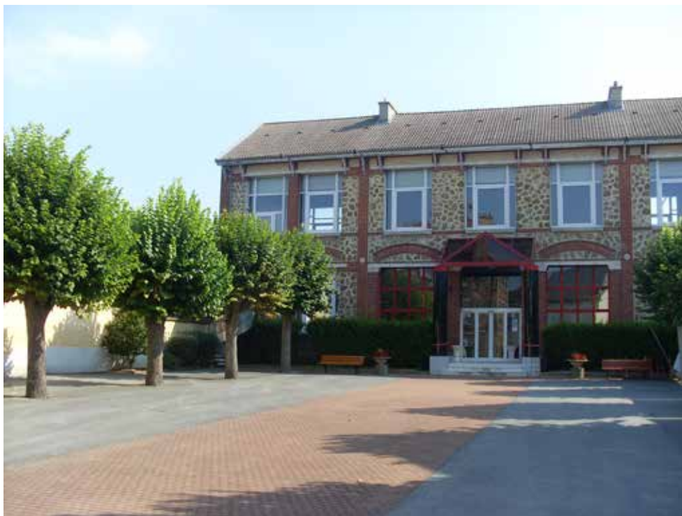
Façade de l'Espace Culturel Pierre GODBILLON