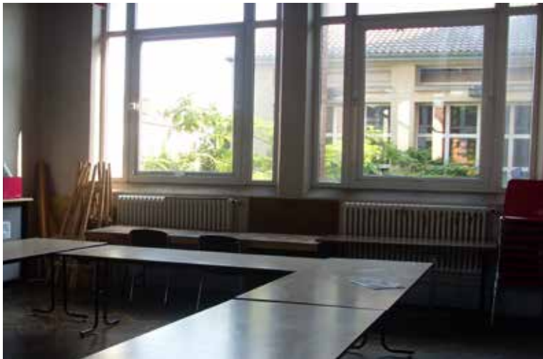
Salle de Réunions