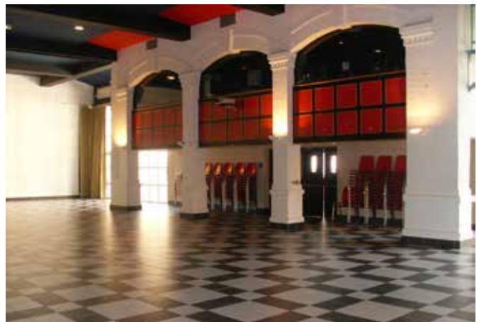
Salle de Spectacles