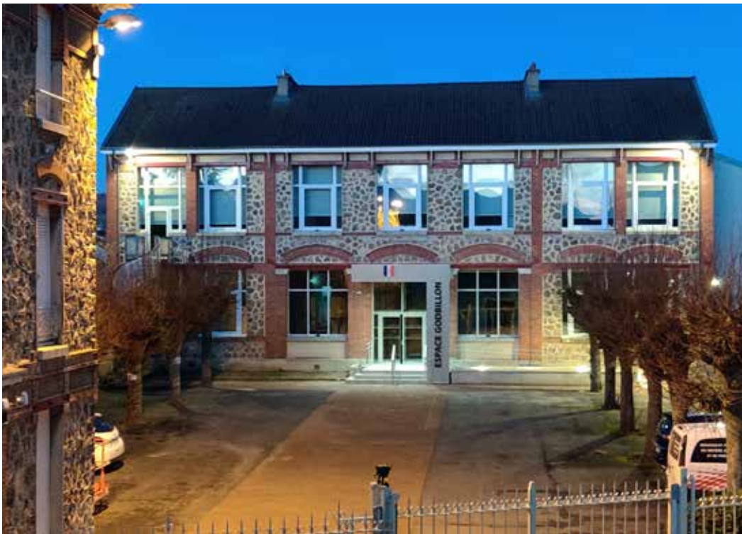
Façade de l'Espace Culturel Pierre GODBILLON