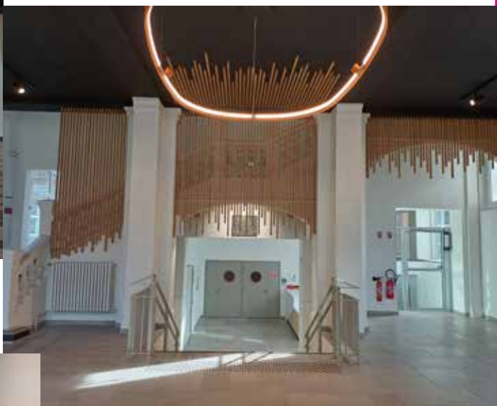
Le Hall d'Entrée