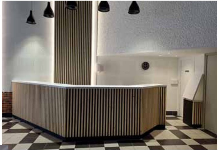
La salle de Réunions Michel BREX