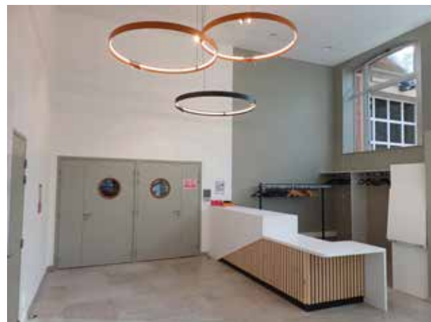
Salle de Spectacles