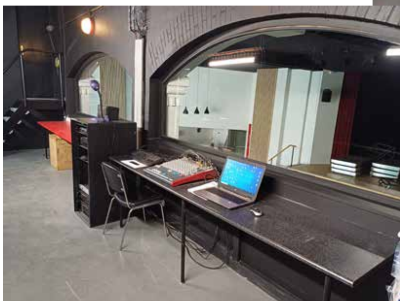
La régie Son-Image