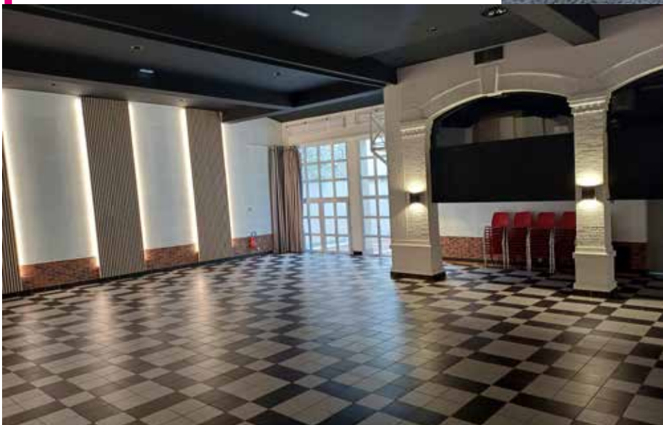
La Salle de Spectacles