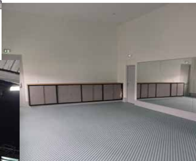
La salle de Gym - Yoga