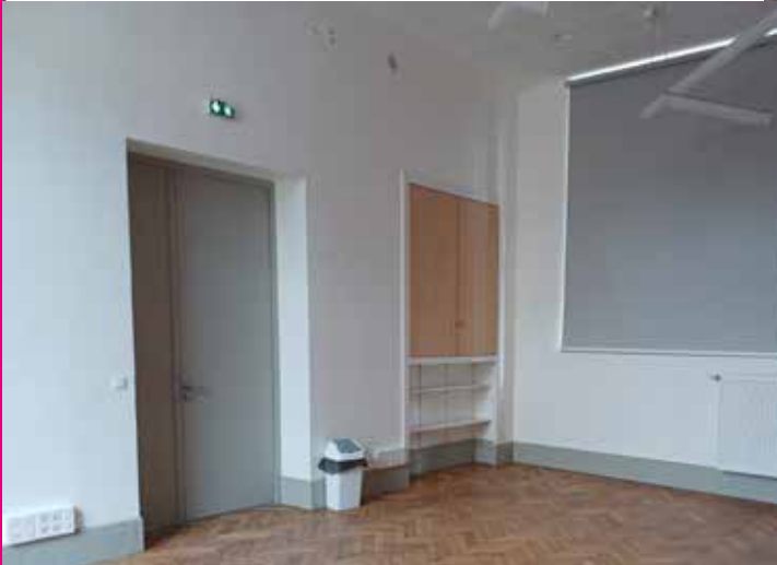
Une salle de Réunions