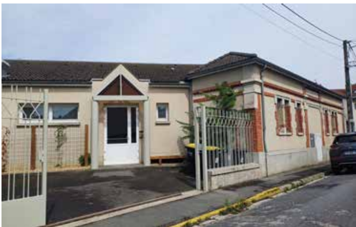
Entrée de service rue Carnot